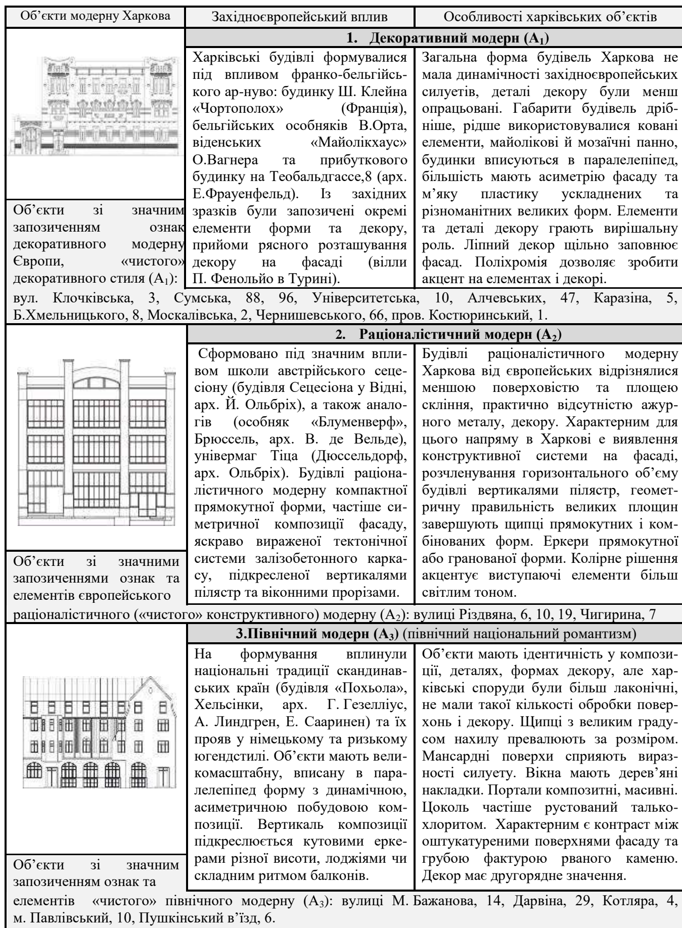
Рис. 1. Основні напрями впливу західноєвропейського модерну на архітектуру модерну Харкова